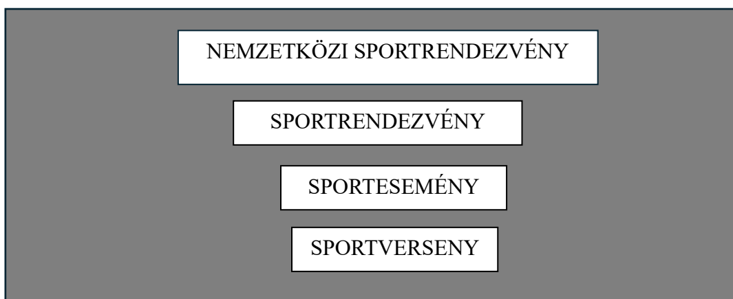
1. ábra: A sportversenyek, sportesemények, sportrendezvény hármass tartalmi lehatárolására

A sportversenyek jelentik a kiindulási pontot, és a sportesemények meghatározásán keresztül jutunk el a sportrendezvények jellemzőinek összefoglalásához, amely a nemzetközi jelzővel kiegészülve adja a kategória legmagasabb szintjét.